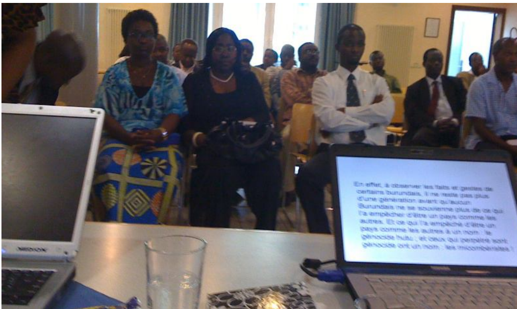
Vue du public

«Le CDP reste le seul parti d'avenir pour le Burundi.», dit un participant plus que convaincu.